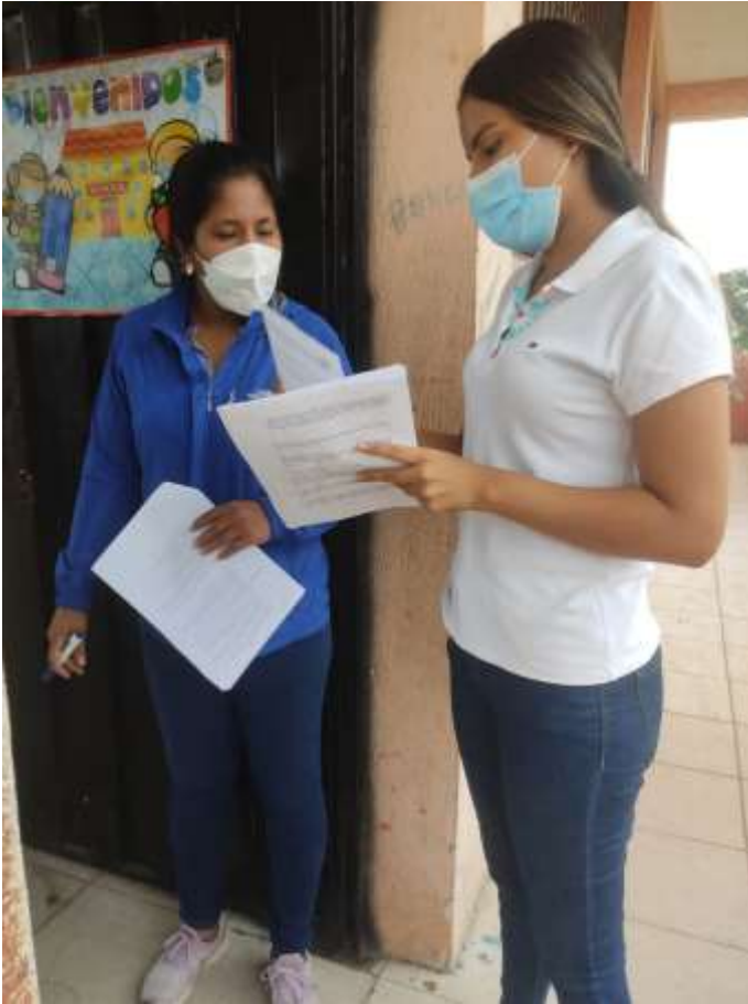
Foto 2. Observación a niños