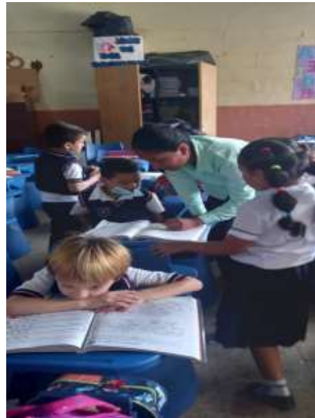
Foto 2. Integración con los estudiantes