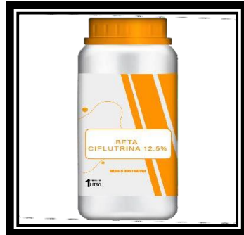
Figura 4. Control químico con clorhidrato, ciflutrina y aver,evermectina