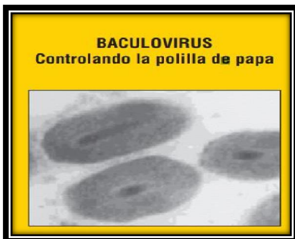
Figura 3. Control de las larvas de la polilla de la papa mediante Baculovirus Phthorimae