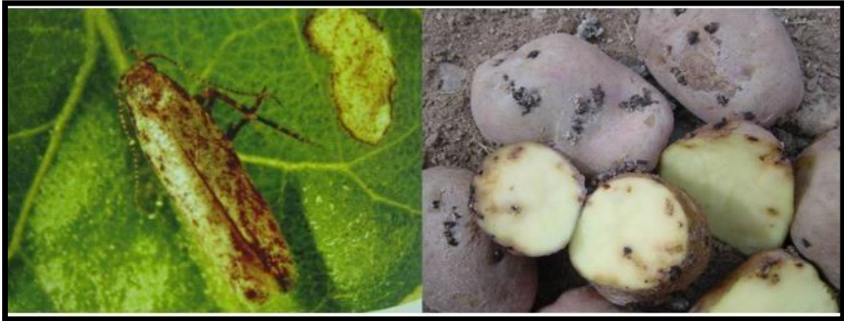
Figura 1. Adulto de la polilla de la papa y sus daños en el tubérculo