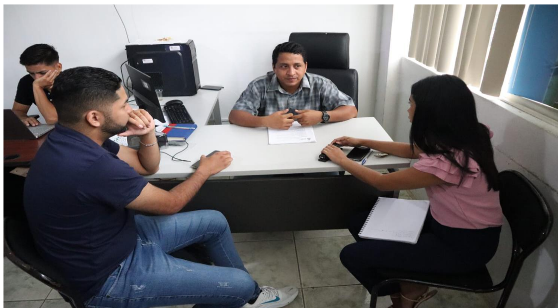
Anexo 3: Entrevista al encargado del departamento de relaciones públicas del GAD BABA