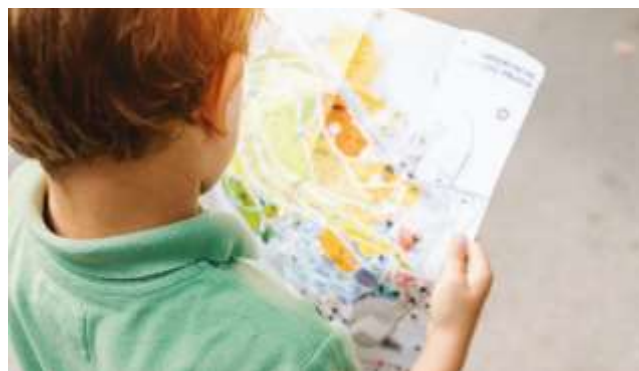
Actividad búsqueda de tesoro