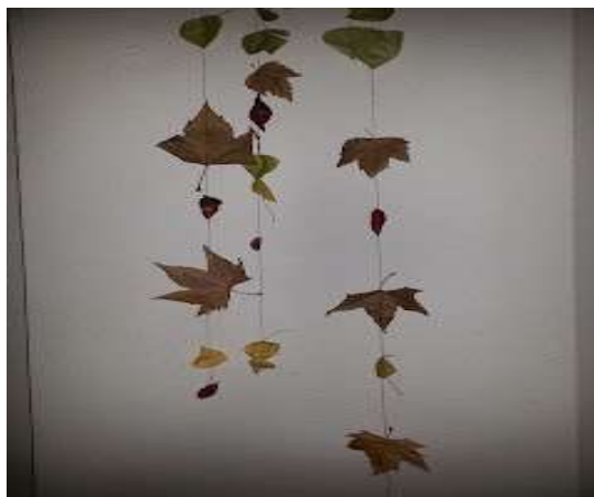
Actividad móvil de hojas