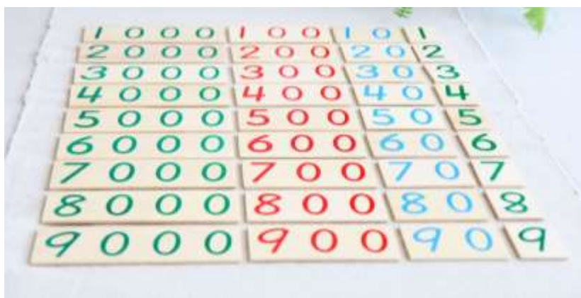
Actividad el juego de ceros