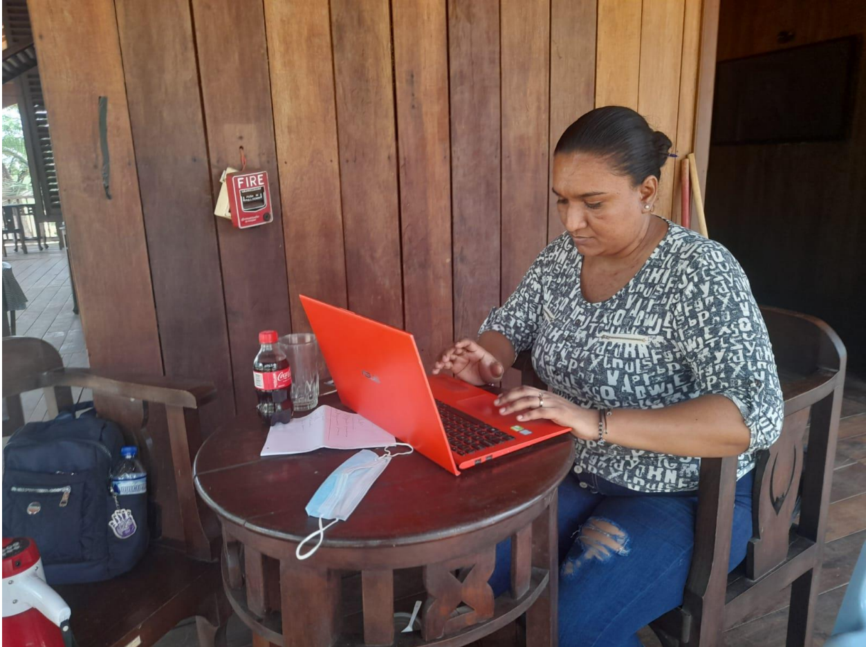
Elaboración de la entrevista y encuestas para la muestra a la que será aplicada.