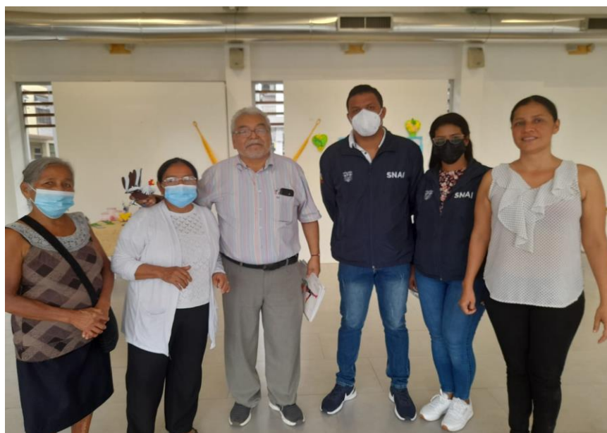
Centro de Arte y Cultura “Gary Esparza Fabiani”