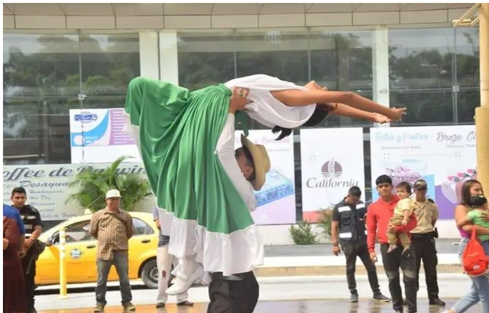
Evento cultural realizado por la Casa de la Cultura Núcleo de Los Ríos.