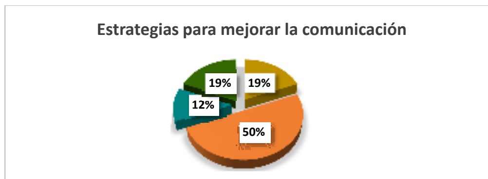
Gráfico 5.-Estrategias para mejorar la comunicación