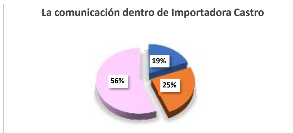
Gráfico 2.-La comunicación dentro de importadora Castro