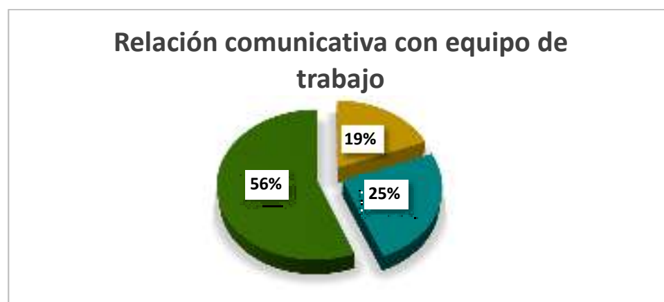
Gráfico 3.-Relación comunicativa con equipo de trabajo