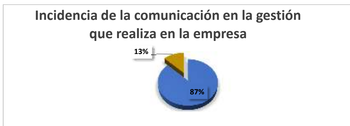
Gráfico 1.-Incidencia de la comunicación en la gestión que realiza en la empresa