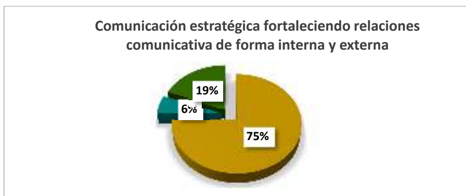
Gráfico 4.-Comunicación estratégica fortaleciendo relaciones comunicativas de forma interna o externa