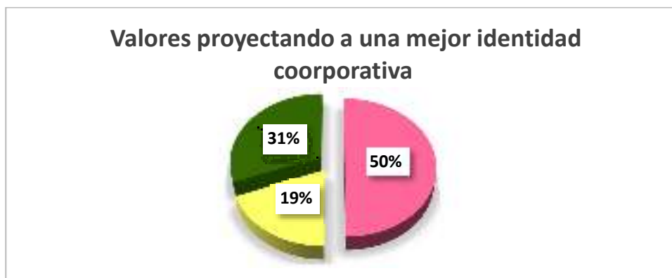
Gráfico 8.-Valores proyectando una mejor identidad corporativa