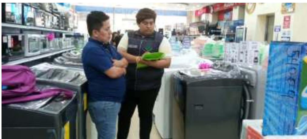
Foto 1. Encuesta realizada