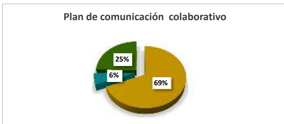
Gráfico 6.-Plan de comunicación colaborativo