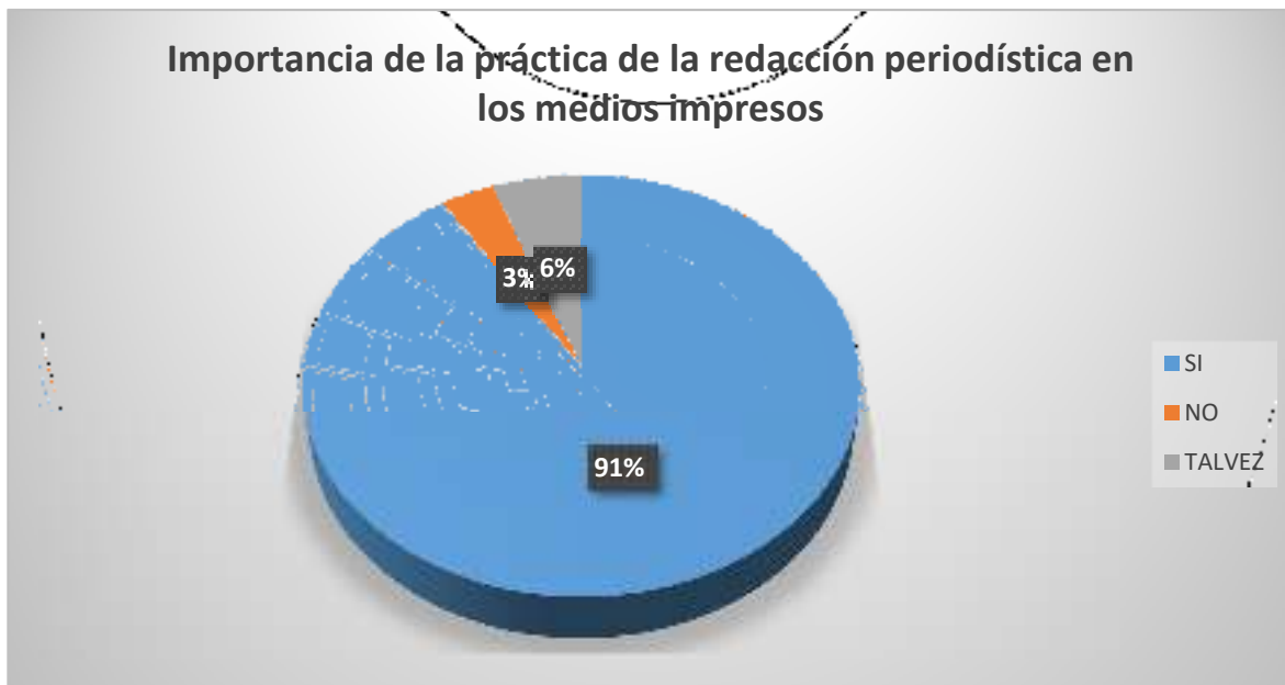
Gráfico 1 Importancia de la práctica de la redacción periodística en los medios impresos

Según se observa en la figura 1, el 91% de los encuestados dice que, si considera que la buena práctica de la redacción periodística en los medios impresos es importante para los estudiantes de comunicación, mientras el 3% manifiesta que no y el 6% dijo que talvez.