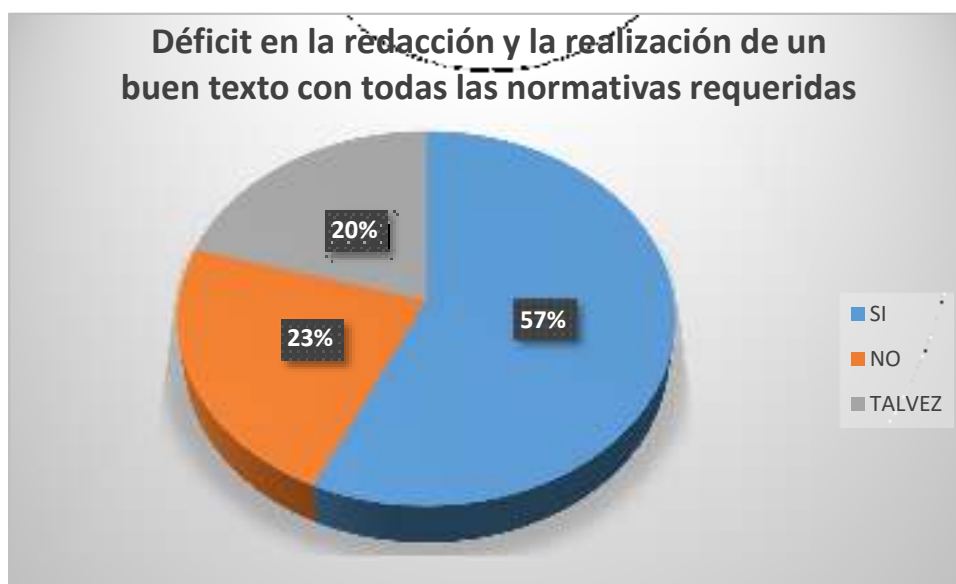
Gráfico 7 Déficit en la redacción y la realización de un buen texto con todas las normativas requeridas

Según se observa en la figura 1, el 57% de los encuestados dice que, si tiene déficit en la redacción y la realización de un buen texto con todas las normativas requeridas, mientras el 23% manifiesta que no, el 20% dijo que talvez.