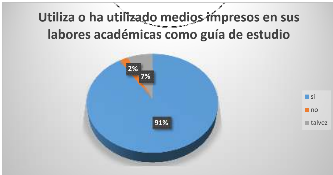
Gráfico 6 Utiliza o ha utilizado medios impresos en sus labores académicas como guía de estudio

Según se observa en la figura 1, el 91% de los encuestados dice que, si utiliza o ha utilizado medios impresos en sus labores académicas como guía de estudio, mientras el 2% manifiesta que no y el 7% dijo que talvez.