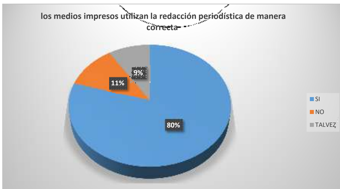
Gráfico 2 los medios impresos utilizan la redacción periodística de manera correcta

Según se observa en la figura 2, el 80% de los encuestados dice que, si ha sido testigo o ha observado si los medios impresos utilizan la redacción periodística de manera correcta o comenten errores de tipo ortográfico en sus publicaciones, mientras el 11% manifiesta que no y el 9% dijo que talvez.