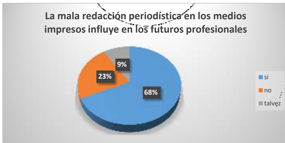
Gráfico La mala redacción periodística en los medios impresos influye en los futuros profesionales

Según se observa en la figura 1, el 68% de los encuestados dice que, si cree que una mala redacción periodística en los medios impresos influye en los futuros profesionales que siguen la misma línea de comunicación social, mientras el 15% manifiesta que no y el 17% dijo que talvez.