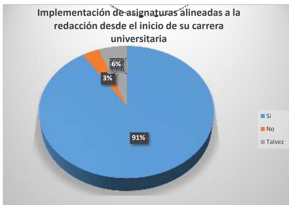
Gráfico 9 Implementación de asignaturas alineadas a la redacción desde el inicio de su carrera universitaria

Según se observa en la figura 1, el 91% de los encuestados dice que, si considera importante que se implemente asignaturas alineadas a la redacción desde el inicio de su carrera universitaria, mientras el 3% manifiesta que no conoce las estrategias comunicacionales, el 6% dijo que talvez.