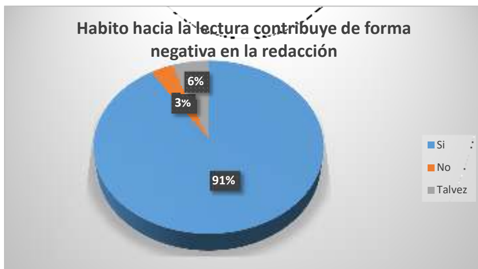
Gráfico 8 Habito hacia la lectura contribuye de forma negativa en la redacción

Según se observa en la figura 1, el 91% de los encuestados dice, que el poco habito hacia la lectura contribuye de forma negativa en la redacción, mientras el 3% manifiesta que no, el 6% dijo que talvez.