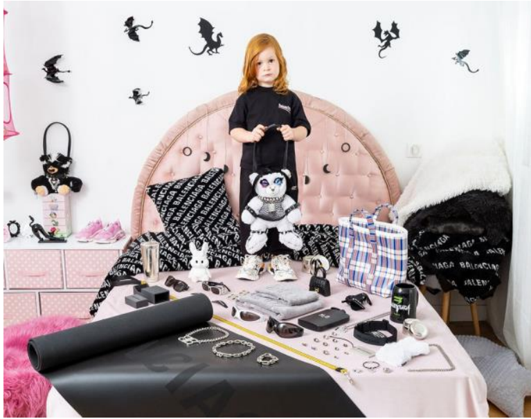
Figura 1 Imagen de la campaña navideña de Balenciaga 2022