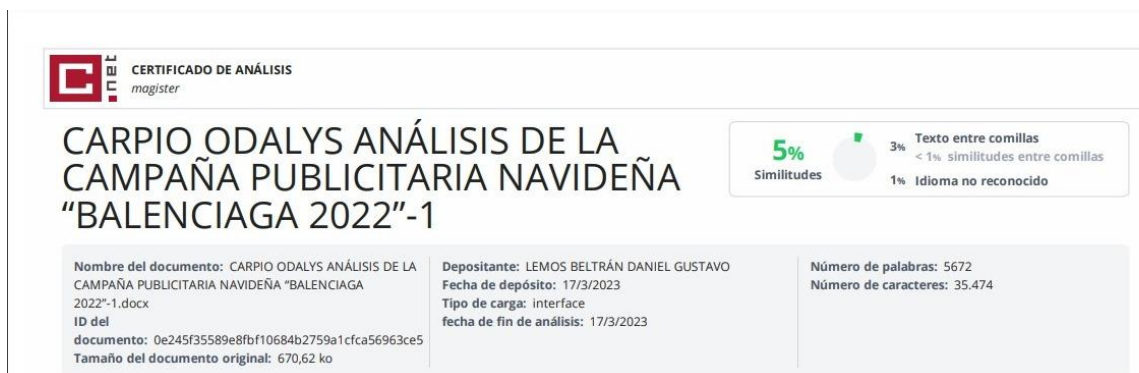
Anexo figura 3 Aprobación de anti plagio por sistema urkund