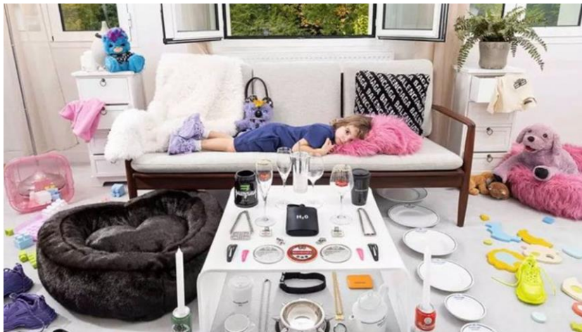
Figura 2 Imagen de la campaña navideña de Balenciaga 2022