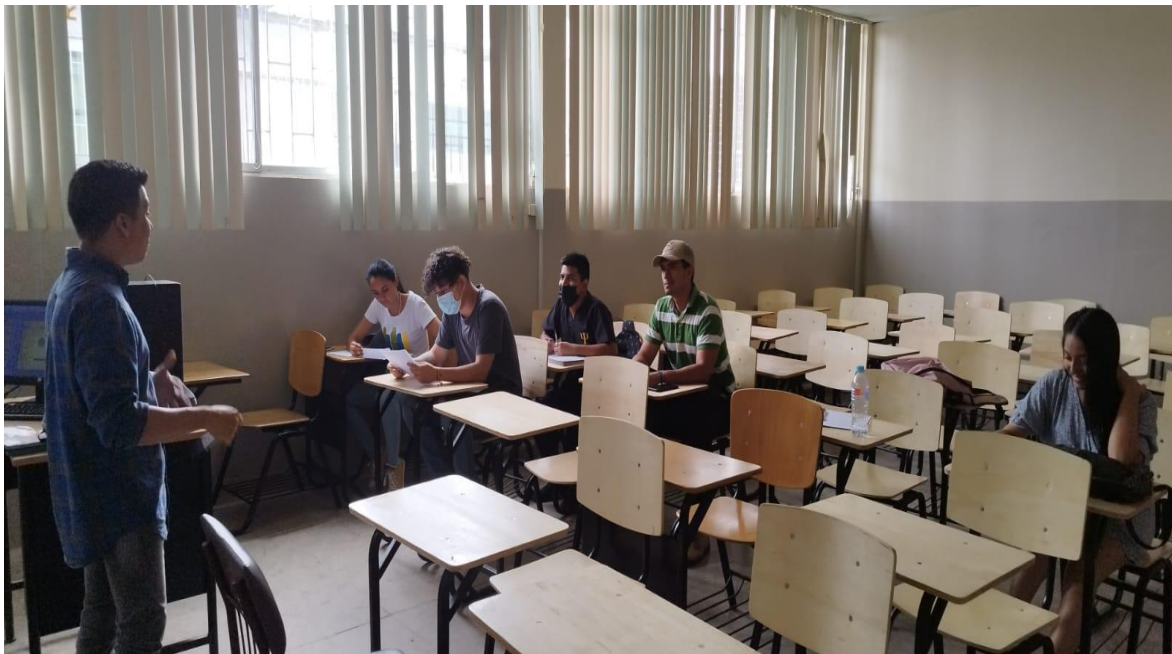
Tutorías para el desarrollo del estudio de caso en aulas de la Universidad Técnica de Babahoyo.