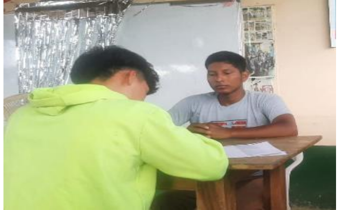
Sesiones de psicoterapia y aplicación de test a paciente de 16 años con depresión.