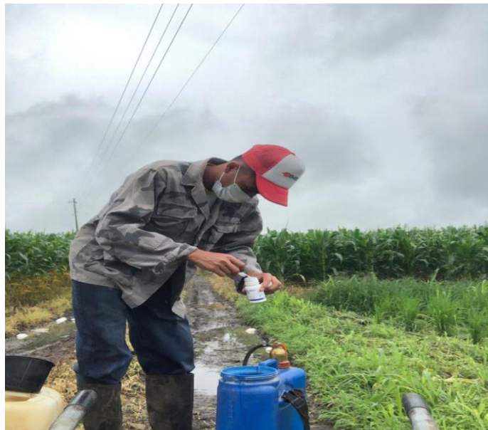
Figura 5. Aplicación herbicida post emergente Byspiribac Sodium