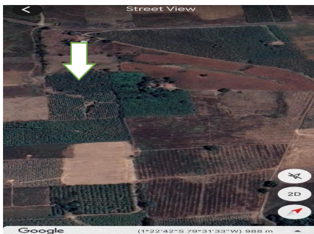
Figura 1. Ubicación del ensayo mediante Google Earth

Características edafoclimáticas de la zona. Temperatura promedio anual: 24 - 26°C, Altitud: 120 msnm, Precipitación anual: 1750 mm hasta 2500 mm Topografía: suelos con pendientes, Suelos: franco arcilloso Clima: Trópico húmedo (GAD MUNICIPAL CANTÓN VENTANAS, 2019)