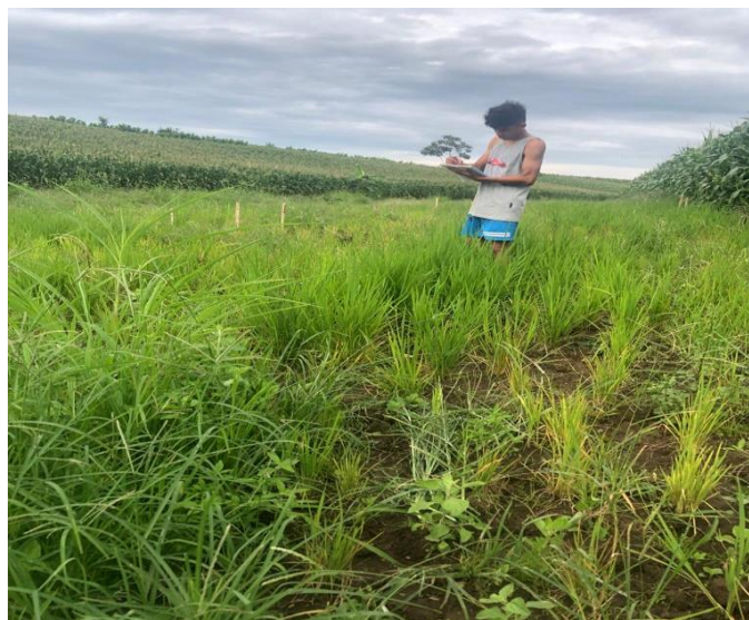
Figura 9. Evaluación de índice de toxicidad