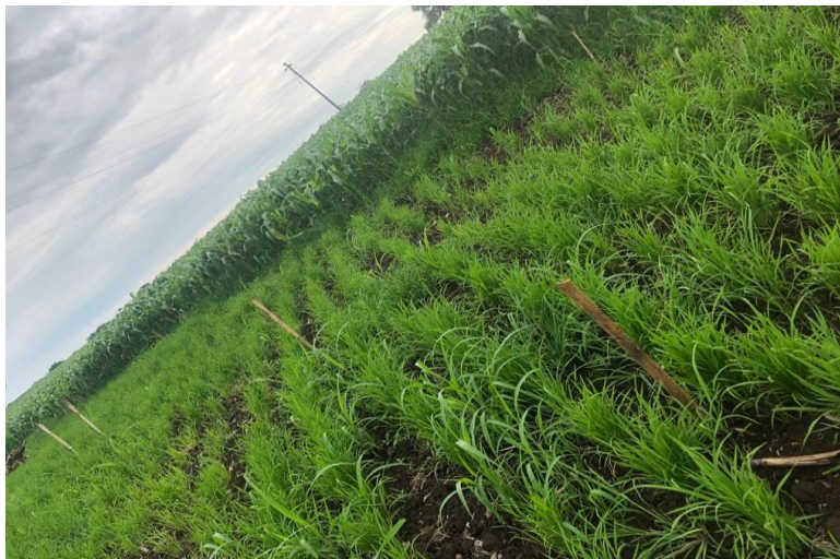
Figura 3. Separación de parcelas