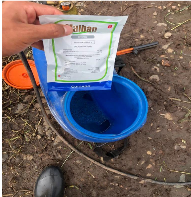
Figura 8. Aplicación del herbicida malban