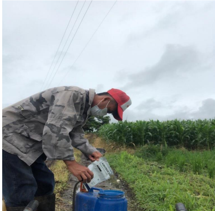
Figura 6. Aplicación del herbicida Kokitron