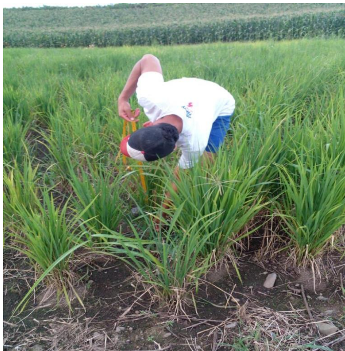
Figura 10. Altura de planta