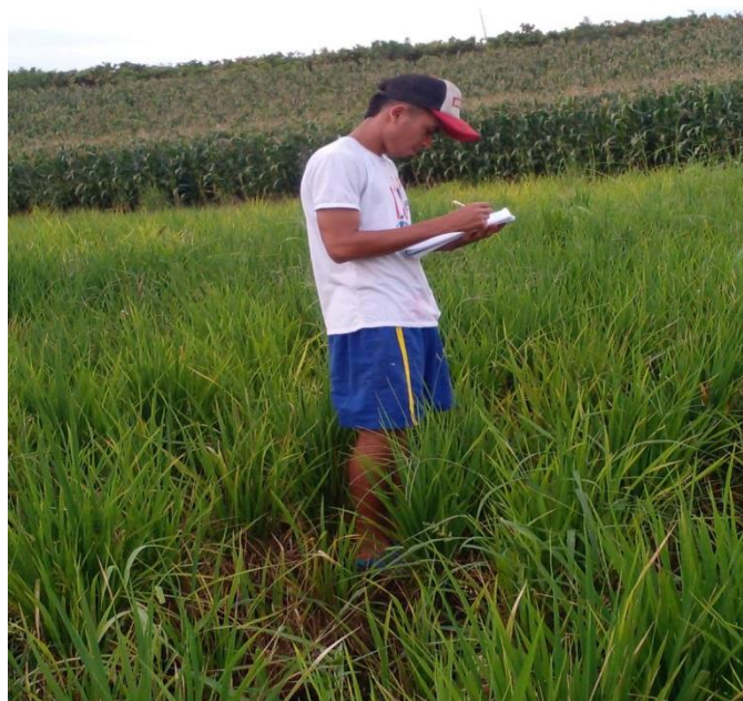
Figura 11. Control de maleza a los 21 días