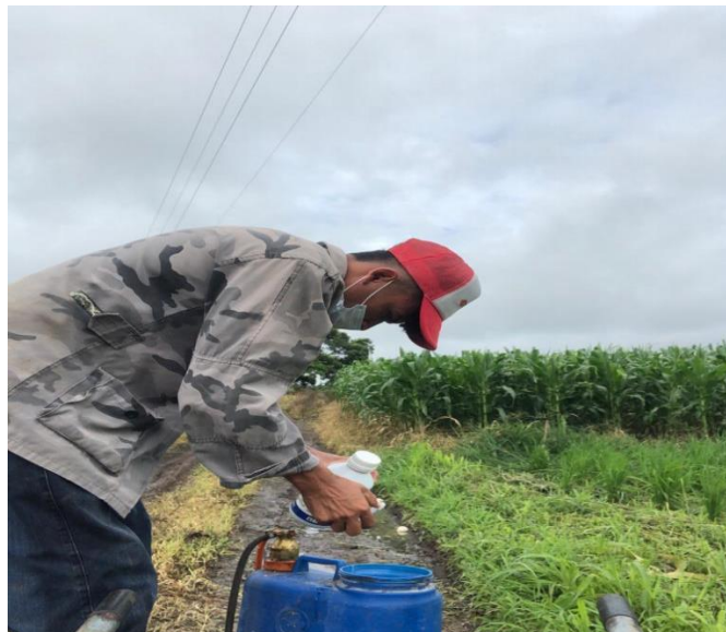
Figura 7. Aplicación del herbicida Clincher