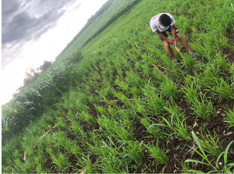
Figura 2. Medición de parcela