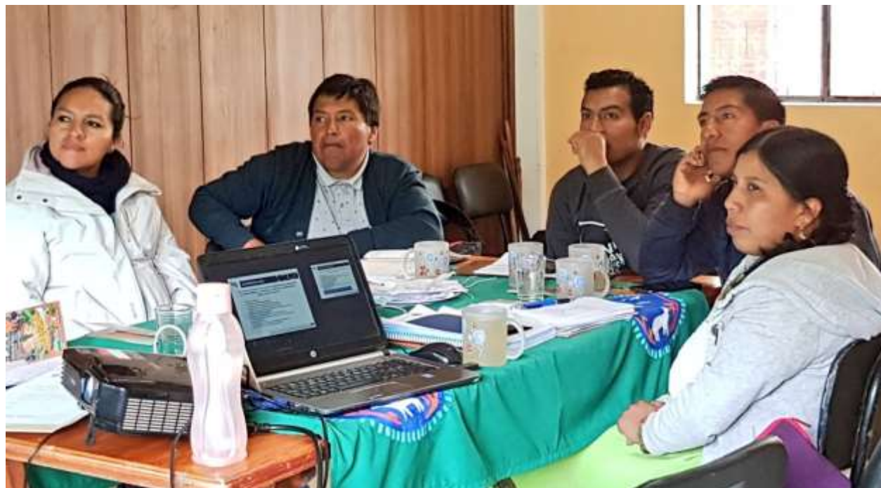
Figura N°2: Comunidad indígena de Zuleta