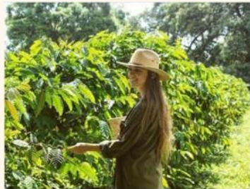
Gráfico 10. Paquete Hacienda Los Prados