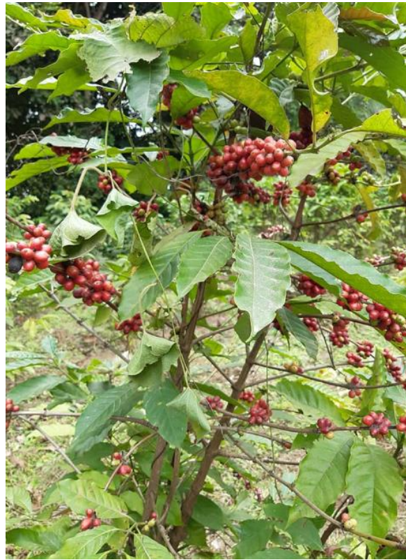
Gráfico 9. Cultivo de café Hacienda Los Prados