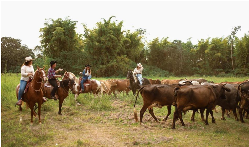
Gráfico 6. Producción ganadera Hacienda Los Prados