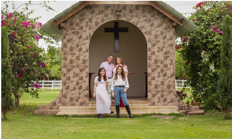
Gráfico 5. Lugar de oración Hacienda Los Prados