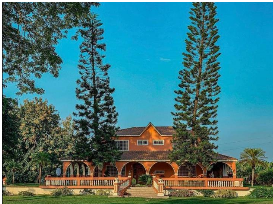
Gráfico 2. Casa principal Hacienda Los Prados