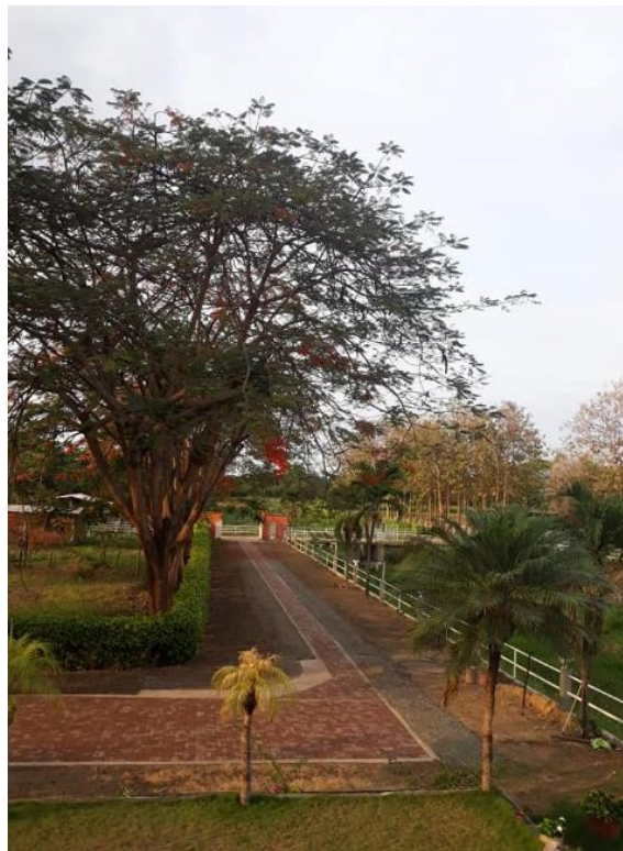
Gráfico 8. Senderos hacienda Los Prados