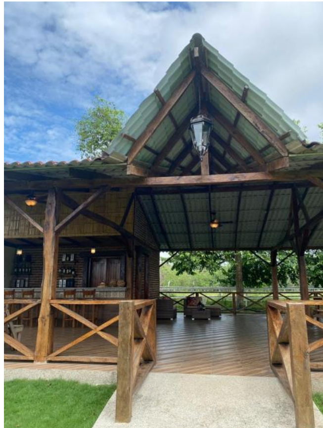
Gráfico 3. Comedor para turistas Hacienda Los Prados