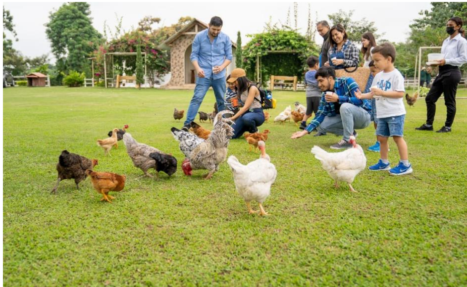
Gráfico 4. Turistas alimentando gallinas ponedoras del lugar.