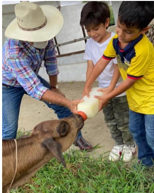
Gráfico 7. Practica agroturismo, alimentación a ganados