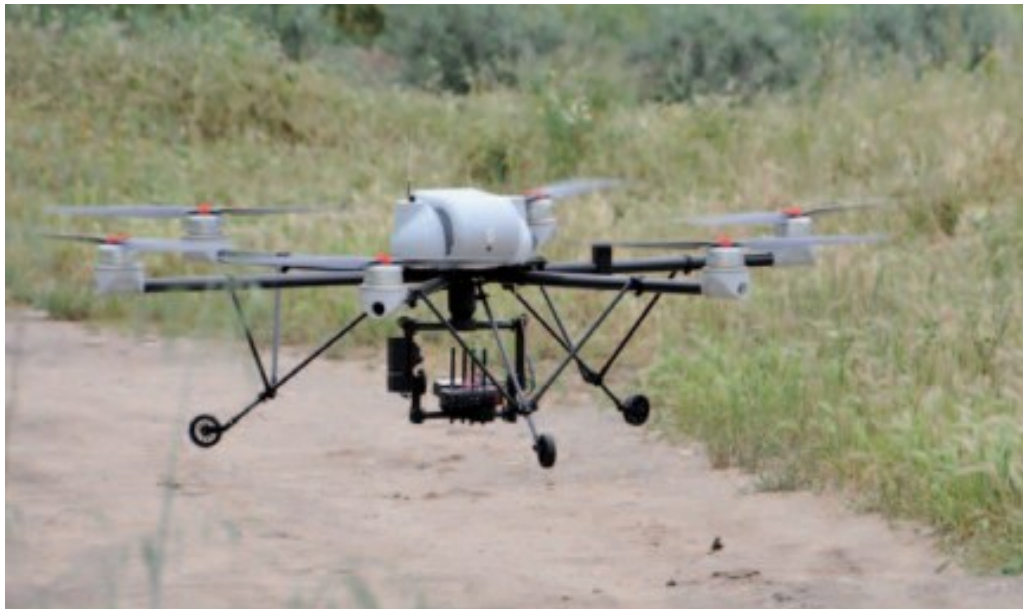
Figura 10 DRON AR200

La utilización de insumos en cultivos de ciclo cortos asume que no se distribuyen de manera uniforme, y no obstante aún al día de hoy los tratamientos se hacen mayormente a grado de parcelas. Una de las causas que justifican esta realidad es la falta de técnicas rápidas, exactas y baratas que abarquen de manera continua nuestros propios campos. Los Drones son la solución propicia a corto plazo y se caracterizan por contar con diversos motores (4, 6 u 8) con accionamiento directo. El control de la rapidez de giro de cada rotor posibilita que la herramienta cambie de dirección o permanezca flotando en postura fija. La figura es parecida a la de una medusa en el océano. Esta gran versatilidad provoca que sean idóneos para conseguir una aplicación impecable (Barreiro et al. 2014:36,38)