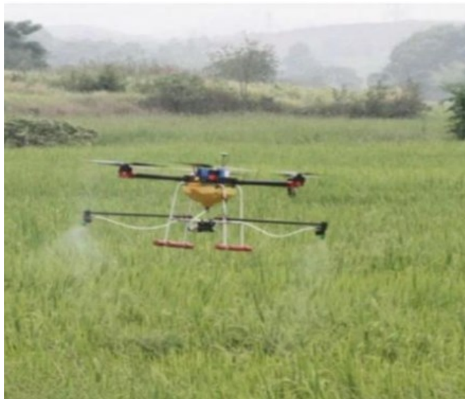
Figura 11 DRON REALIZANDO APLICACIÓN DE AGROQUIMICOS