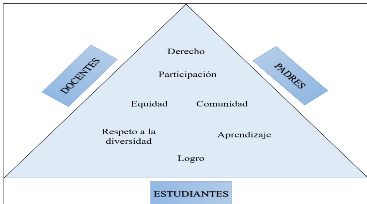
Figura 1 Triada educativa y valores inclusivos compartidos

Nota: la figura representa los componentes de la triada educativa. Tomada de (Molina, 2019)