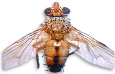
Imagen 10: Chrysoperla carnea