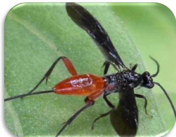
Imagen 8: Alabagus spp