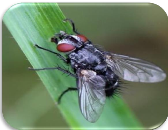
Imagen 7: Lydella minense