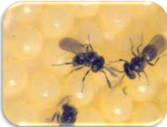
Imagen 3: Telenomus remus