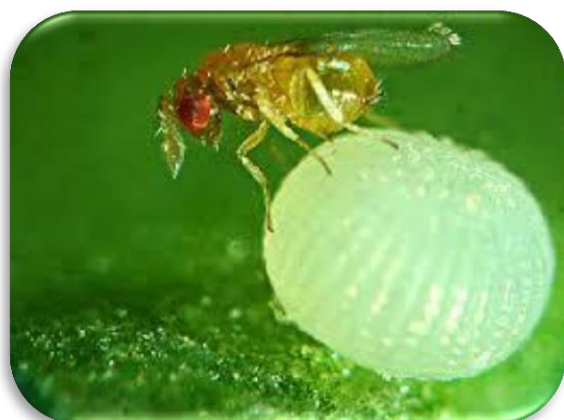
Imagen 2: Trichogramma exiguum