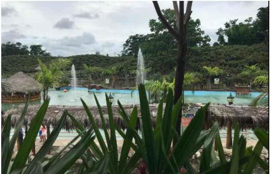
Ilustración 3. Complejo turístico Emely