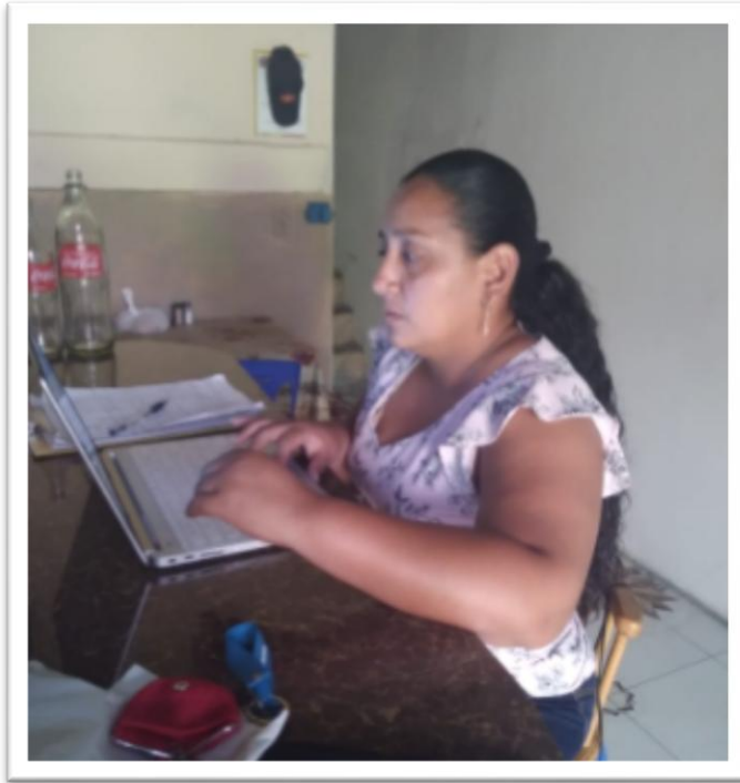
Figura 2. Terminando últimos detalles de mi trabajo de investigación.

Figura1. En la elaboración del trabajo de investigación sobre conciencia fonológicas en el proceso de aprendizaje de la lectoescritura en educación inicial