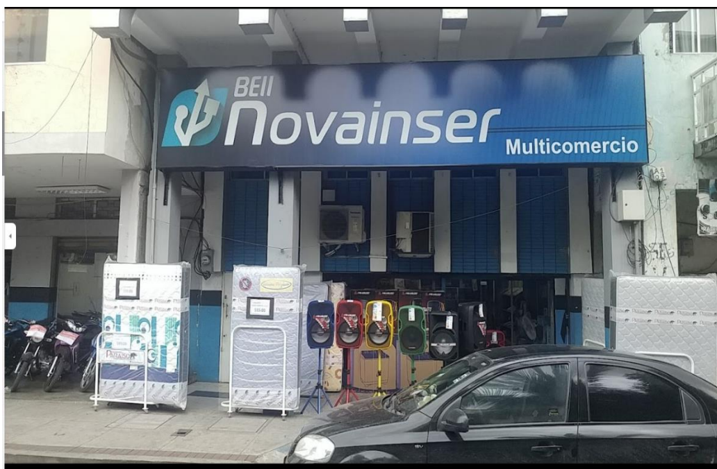
Ilustración 3. Sede principal de la empresa BELL Novainser. S.A

Calles: Av. General Barona Entre 27 de mayo y, Pedro Carbo