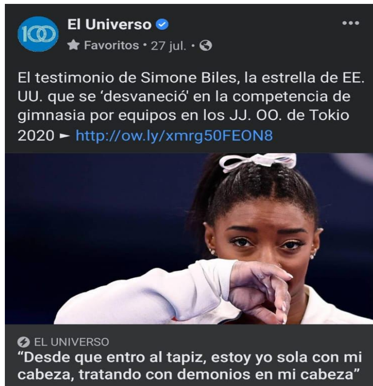
Ilustración 5. Análisis de contenido de la red social Facebook del diario El Universo Foto: Captura de pantalla