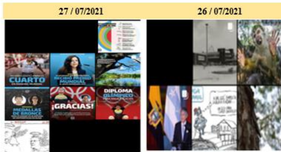
Ilustración 4. Análisis de contenido de la red social Instagram del diario El Universo