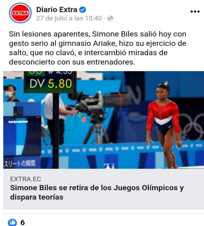
Ilustración 3. Análisis de contenido de la red social Facebook del diario Extra