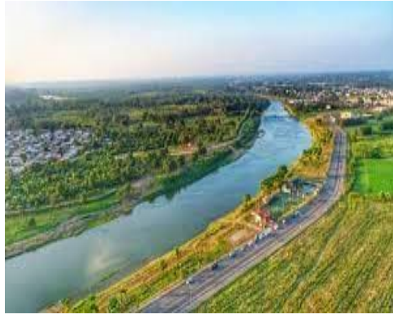
1. Paisaje de Quevedo