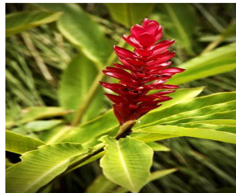
6. Flora del Cantón Quevedo