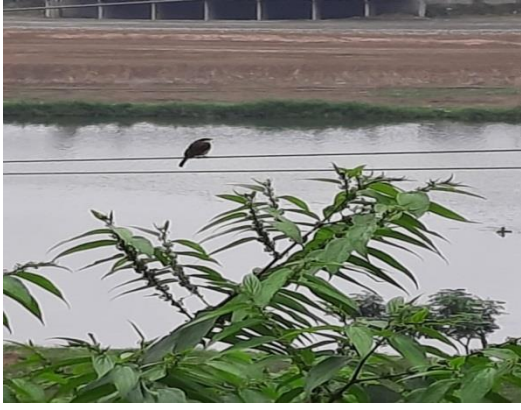
5. Observación de aves Ruta del Río