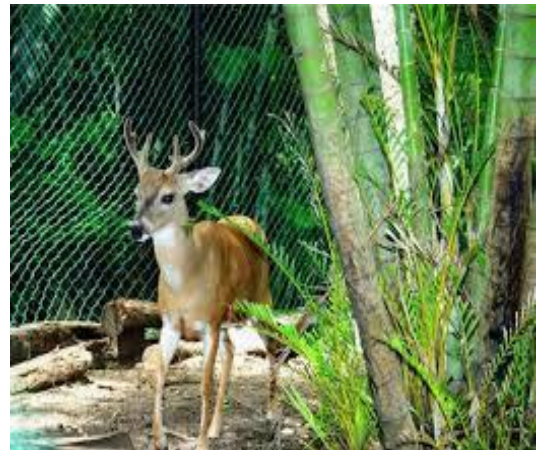
4. Fauna del Cantón Quevedo