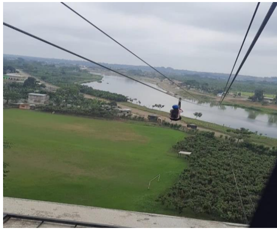
3. Canopy Ruta del Rio