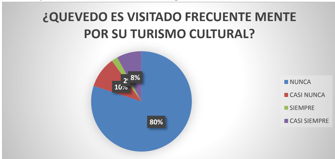
Gráfico 2 ¿Quevedo es visitado frecuentemente por su turismo cultural?

Fuente: Encuesta online a la Ciudadanía del Cantón Quevedo Elaborador por: BRICEY BRIGITTE ESPAÑA ACOSTA.