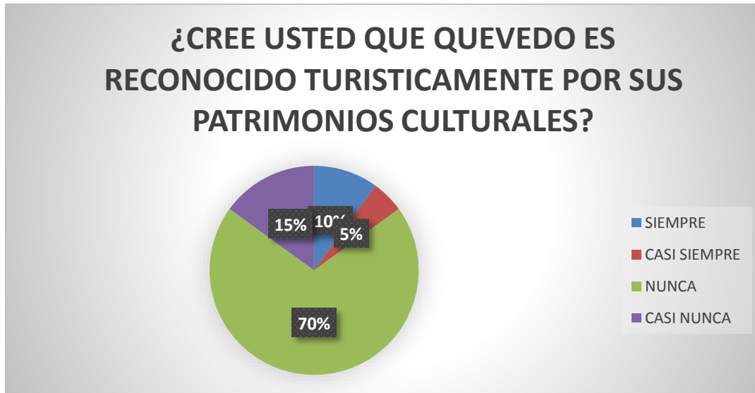
Gráfico 1 ¿Cree usted que Quevedo es reconocido turísticamente por sus patrimonios culturales?

Fuente: Encuesta online a la Ciudadanía del Cantón Quevedo Elaborador por: BRICEY BRIGITTE ESPAÑA ACOSTA