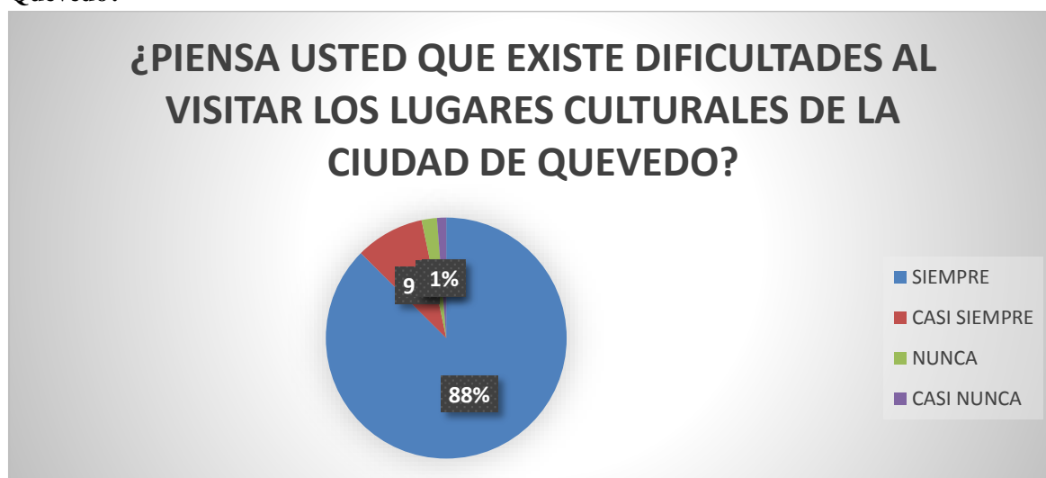
Gráfico 3 ¿Piensa usted que existe dificultades al visitar a los lugares culturales de la ciudad de Quevedo?

Fuente: Encuesta online a la Ciudadanía del Cantón Quevedo Elaborador por: BRICEY BRIGITTE ESPAÑA ACOSTA.