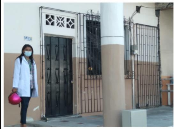
REALIZANDO VISITAS DOMICILIARIAS PARA HACER EL RESPECTIVO SEGUIMIENTO Y VALORACIONES PSICOLOGICAS