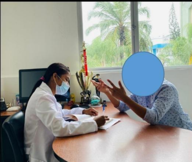
APLICACIÓN DE TEST PSICOMETRICOS