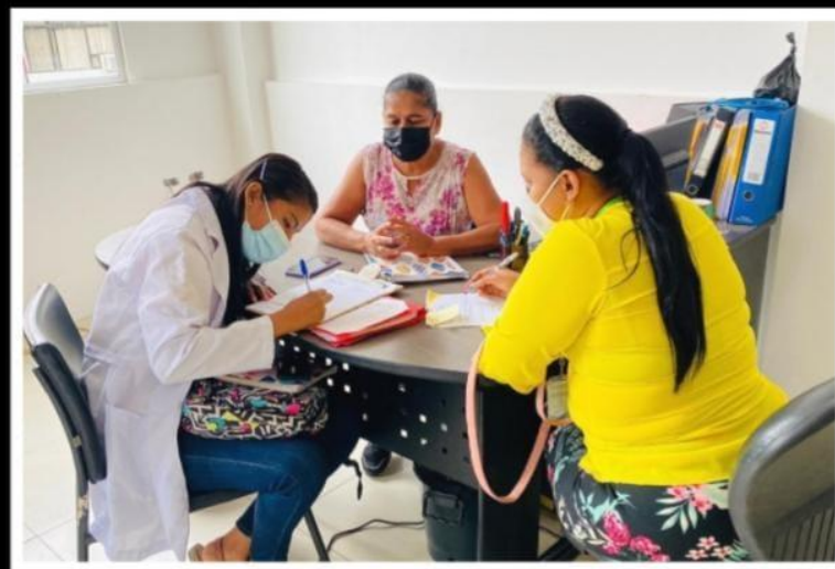
VISITA POR PARTE DE MI TUTORA DE PPP AL CONSEJO CANTONAL DE PROTECCION DE DERECHOS