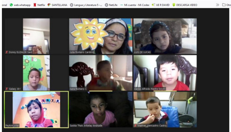
Clases virtuales: Usando estrategias educativas