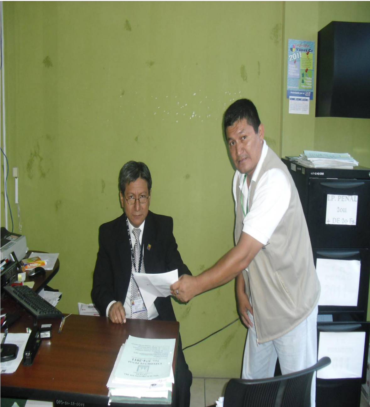
El Autor del trabajo de investigación con el secretario de la Fiscalía del Cantón Naranjito