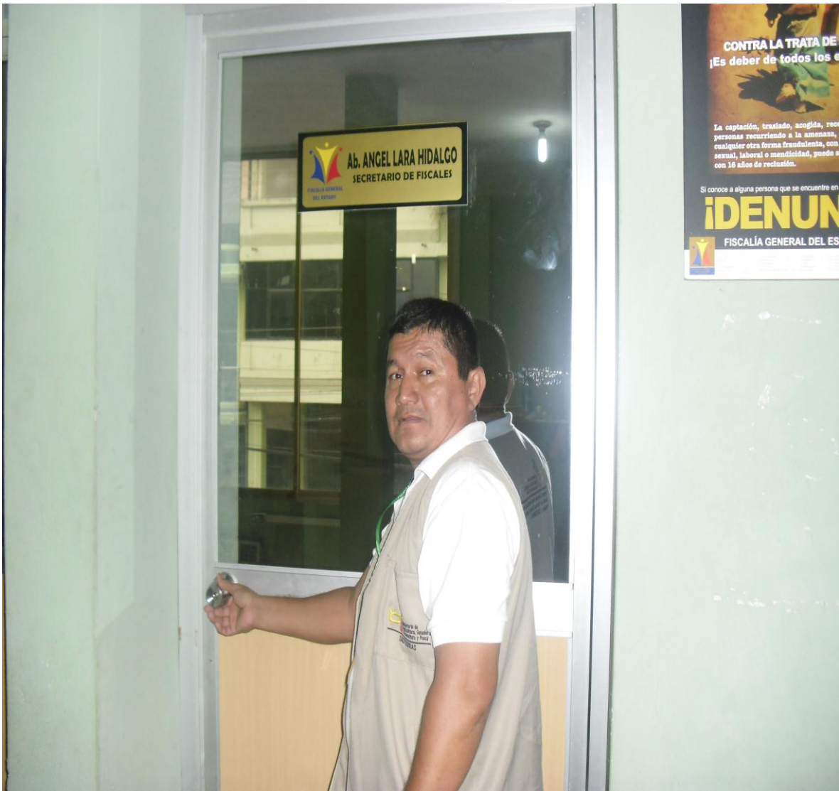
El autor del trabajo investigativo entrando a la fiscalia