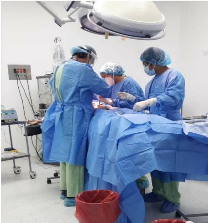
IRE. Lady Jiménez asistiendo al cirujano en apendicetomía.