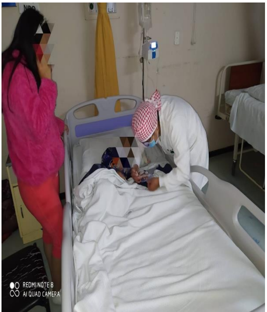
ANEXO 3. Administración de medicamentos