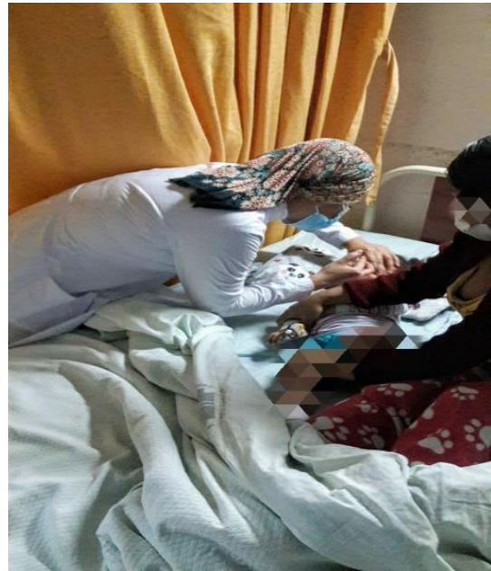
ANEXO 2. Cuidados de enfermería al paciente