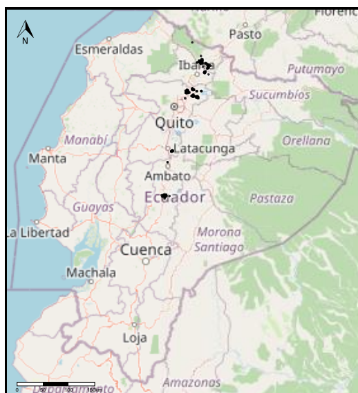
Figura 1. Puntos de intervención de proyectos de mecanización.

Uno de los principales problemas es la dependencia de la agricultura ecuatoriana en gran medida de algunos países en lo que respecta a la importación de maquinaria agrícola. Los principales mercados de importación en 2017 fueron China (26,22%), Brasil (14,93%), Estados Unidos (10,96%) e Italia (4,53%).