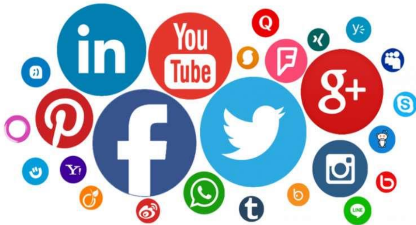
Foto 2. Foros