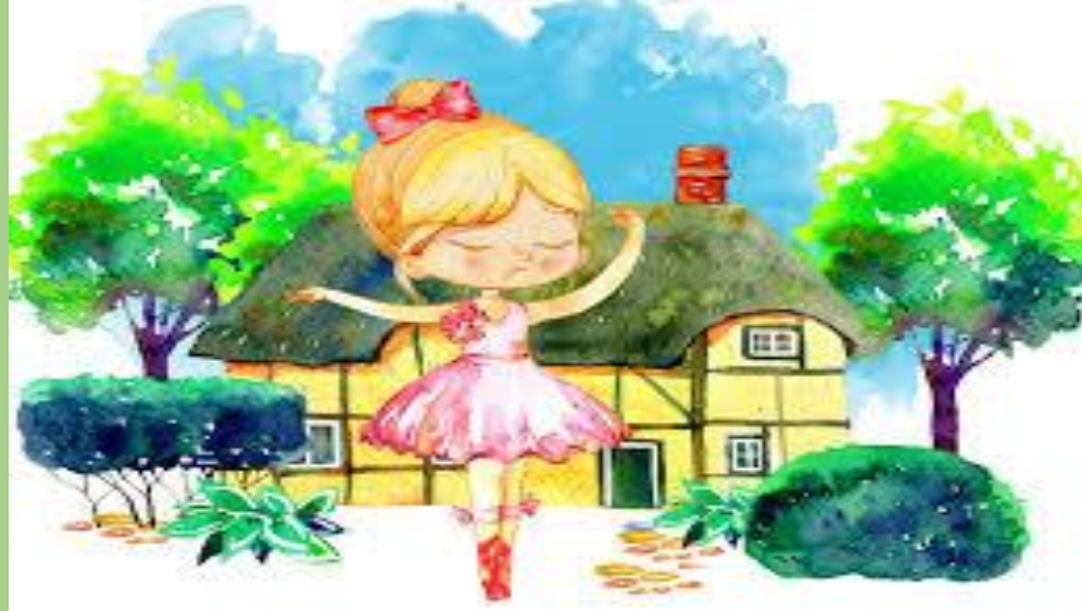
Valores a resaltar en la leyenda de la niña de oro

La felicidad La disciplina El amor a la familia