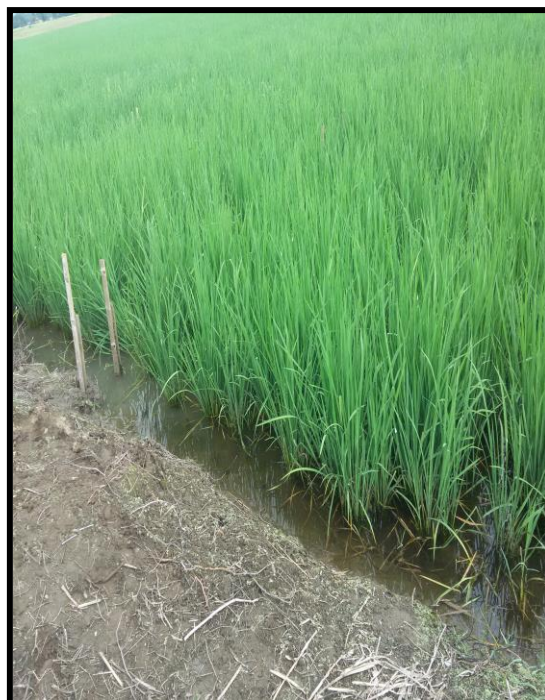
Figura 2. Diferenciación de tratamientos y programas.