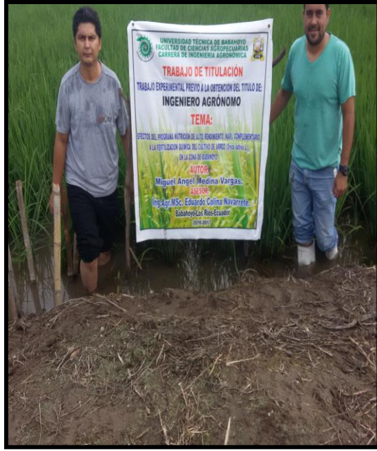
Figura 4. Revisión de trabajo en campo.