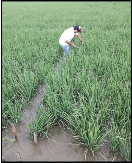
Figura 3. Control de malezas.