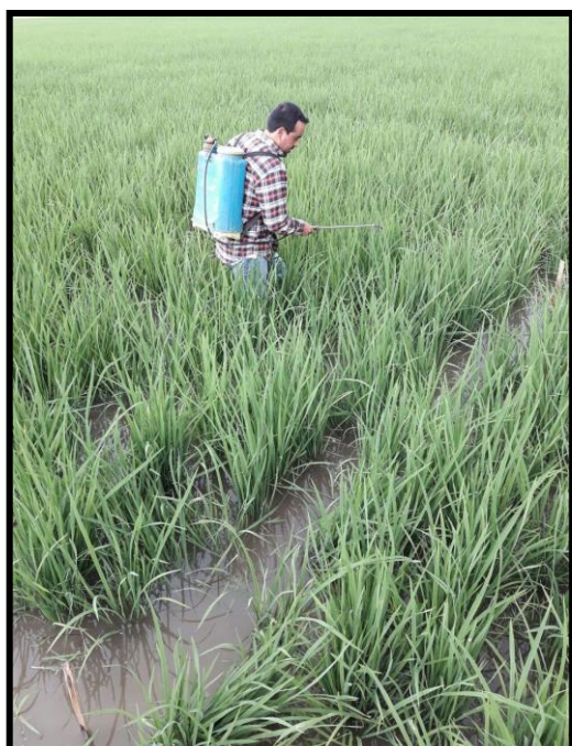
Figura 1. Aplicacion de insecticidas y programas.