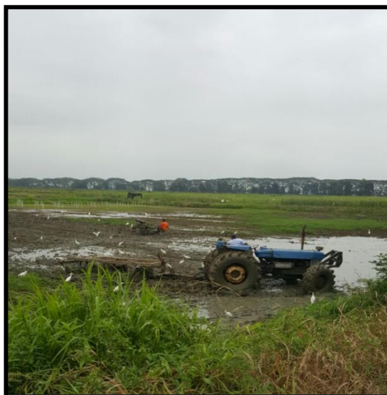
Fig 1. Preparacion del terreno.